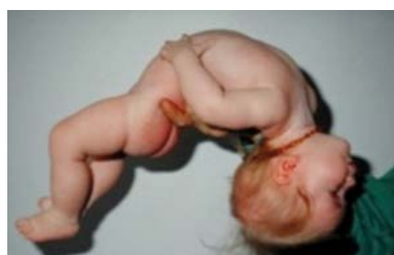
Figura 3. Ipotono di capo e tronco.

In presenza di criteri clinico-anamnestici suggestivi è necessario eseguire indagini genetiche e molecolari. L'esame di primo livello è il test di metilazione del cromosoma 15: tale metodica, mediante tecnica del southern blotting, è in grado di rilevare la differente metilazione presente nella regione critica per gli omologhi parentali. Il riscontro di uno stato di metilazione della regione analizzata compatibile con il mancato contributo paterno è diagnostico di PWS. L'indagine di secondo livello, mediante FISH (Fluorescence In Situ Hybridization) e utilizzo della sonda SNRPN, permette di identificare i casi dovuti a delezione del cromosoma 15 paterno (65-75% dei casi) [4]. Se tale indagine risulta negativa per delezione, è indicata l'analisi dei microsatelliti mediante PCR: questa tecnica permette il confronto tra loci poli-