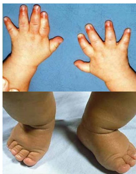
Figura 2. Aspetto tipico di mani e piedi.