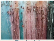
Tra le righe

radicale, che delinea una specifica idea di libertà ; un costituzionalismo democratico e sociale, che assegna ad ogni generazione la facoltà/possibilità di cambiare la costituzione sulla base di nuovi bisogni e di nuovi diritti ; una concezione della cittadinanza sociale che prefigura la genesì dei diritti sociali .