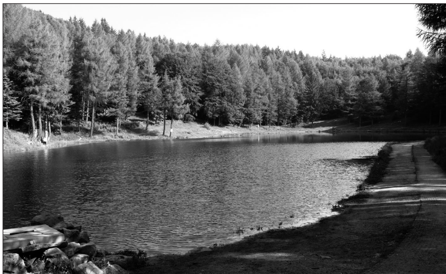
Fig. 1 – Il Lago della Ninfa (Appennino modenese)

Il Lago della Ninfa (Fig. 1) è situato nell'alta valle del Torrente Leo nel versante nord del Monte Cimone ad un'altitudine di 1503 m s.l.m. Si estende su una superficie di 4350 m 2 e raggiunge una profondità massima di circa 2 m. La forma del bacino è irregolare, allungata in direzione nord-sud. Il lago non presenta alcun emissario e manca di un immissario naturale.