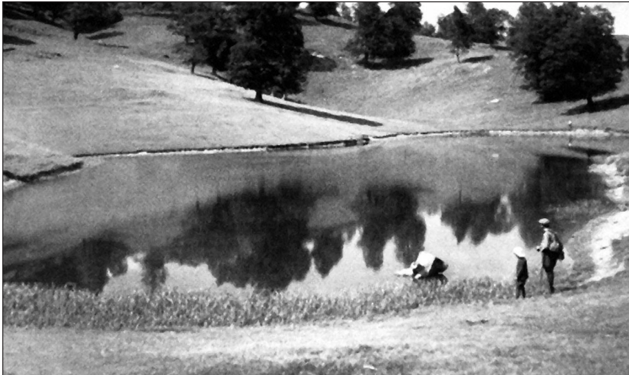
Fig. 2 – Il Lago della Ninfa nella prima metà del '900, allora denominato “Budalone” (da Renzi, 1982)

Circa 20 anni dopo questo intervento, Crema & Zunarelli Vandini (1983) effettuarono uno studio con lo scopo di tracciare un profilo delle zoocenosi che avevano ricolonizzato il lago. In particolare è stata presa in esame la situazione tra il 1977 e il 1979, attraverso lo studio della produttività primaria fitoplanctonica e dei popolamenti zooplanctonici e macrozoobentonici.