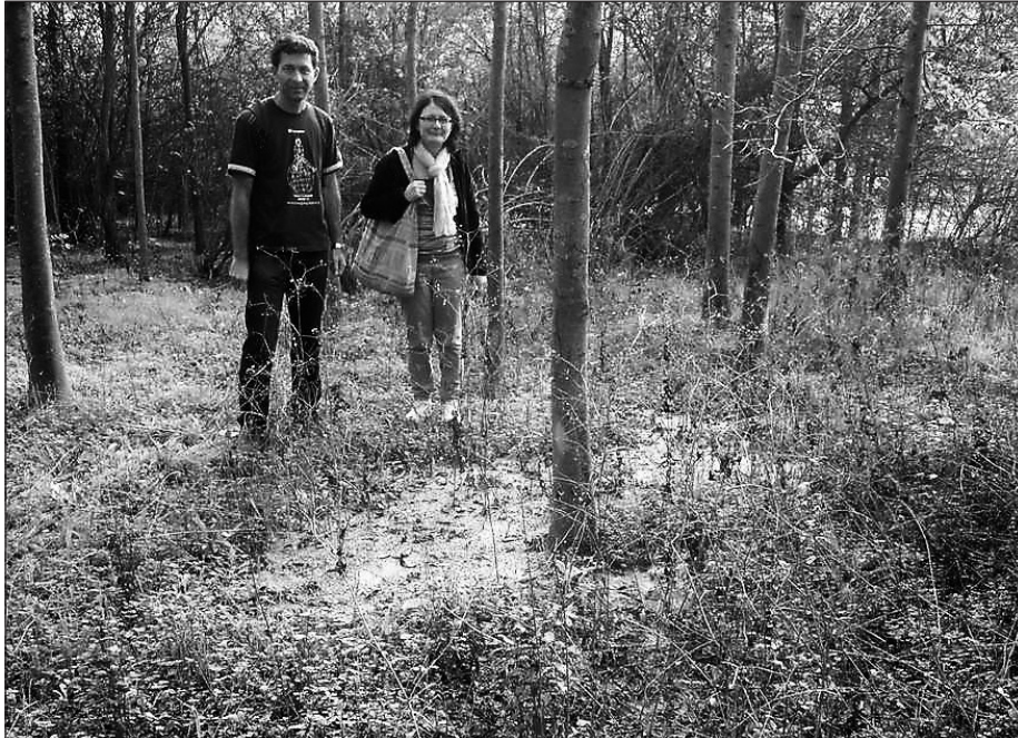
Fig. 4 – Le Salse “C-Garfagnine” nel boschetto a SO di Ca’ Rossa nell’ottobre 2012.

Pertanto, per facilitare l'individuazione degli apparati descritti nei successivi capitoli, si è ritenuto opportuno elaborare una "figura indice" con la nomenclatura di riferimento per le Salse di Nirano utilizzando anche la denominazione locale (Fig. 6).