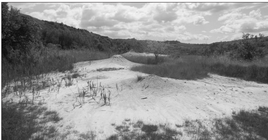
Fig. 7 – Salse “A-Nando Ovest”: piccole salse a cono allineate; sullo sfondo “D-La Giunta” (maggio 2016).

Pochi metri a nord di “G-Fernando” sono ubicate quattro salse a polla, qui denominate “H-Polle alte” del diametro dell’ordine del metro (Fig. 12) che, per le loro ridotte dimensioni, non sono visibili nella carta indice.