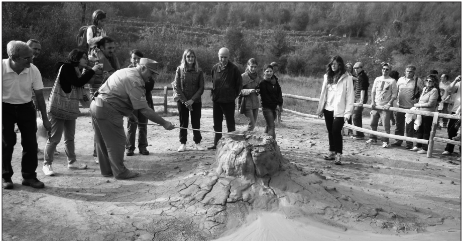
Fig. 3 – La presenza di gas emessi dalle bocche dei vulcani di fango è testimoniata dalla loro infiammabilità la cui dimostrazione è consentita solo alle Guardie Ecologiche Volontarie che presidiano la riserva.

Questo particolarissimo ambiente geologico presenta una morfologia in continua evoluzione: nuove bocche si aprono mentre altre cessano la loro attività. Ciò è dovuto all’alternarsi di periodi di intensa attività con altri di scarsa o nulla attività. Durante questi ultimi il fango seccandosi va ad ostruire il condotto di uscita e il fango deve necessariamente trovare nuove vie di fuoriuscita. Punti lutivomi di nuova generazione si sono formati nella zona dell’Ecomuseo Ca’ Rossa: nel boschetto a sud-ovest del caseggiato (Figg. 4 e 5), dopo i forti terremoti della sequenza sismica emiliana del 2012, e nel piccolo prato ad ovest nel maggio 2016.