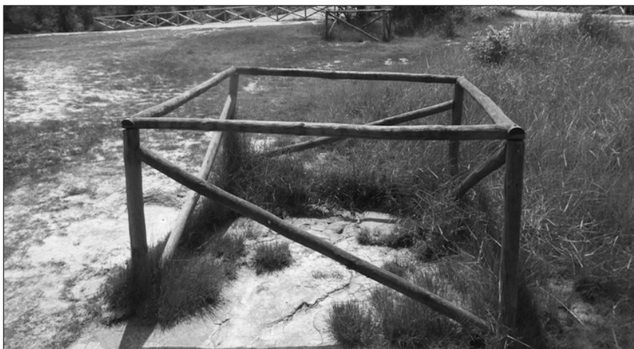
Fig. 12 – Una delle quattro salse dette “Polle alte-H” ubicate a nord di “G-Fernando” (maggio 2016, foto D. Castaldini).