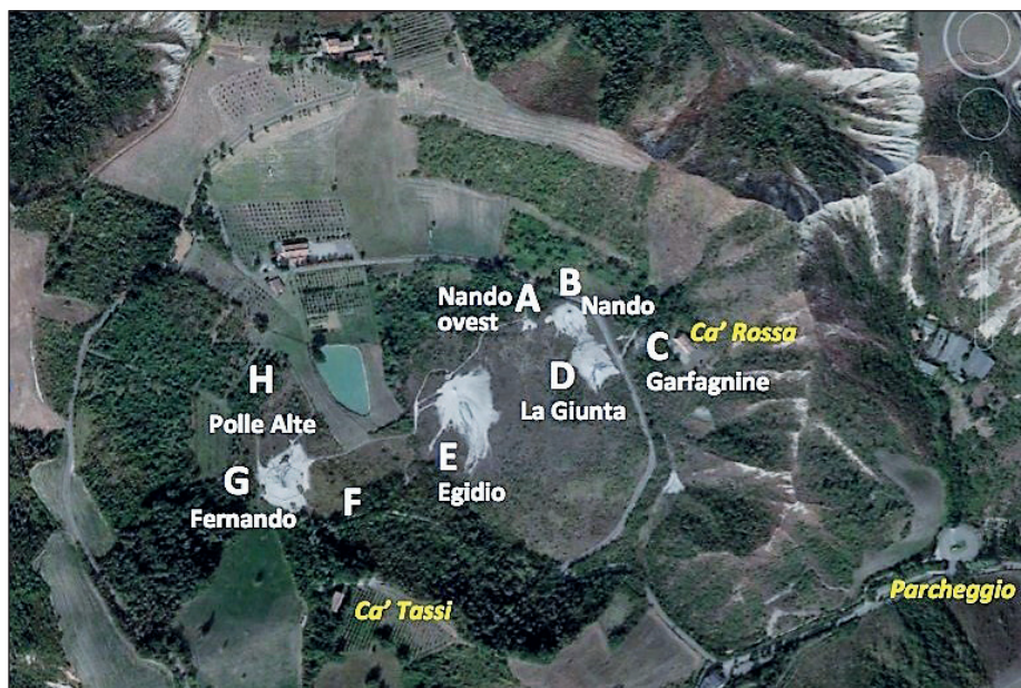
Fig. 6 – Carta indice con nomenclatura di riferimento per le Salse di Nirano (da immagine Google Earth del 28/09/2016).