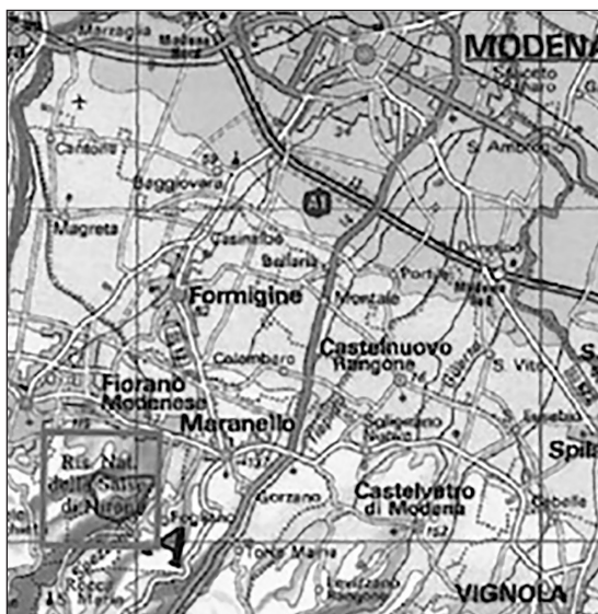
Fig. 1 – Ubicazione geografica dell'area della Riserva Naturale Regionale delle Salse di Nirano (riquadro grigio).

meno dei vulcani di fango nei territori dei comuni emiliani di Maranello, Fiorano Modenese, Sassuolo, Castellarano, Scandiano, Viano (GeoMedia, 2017).