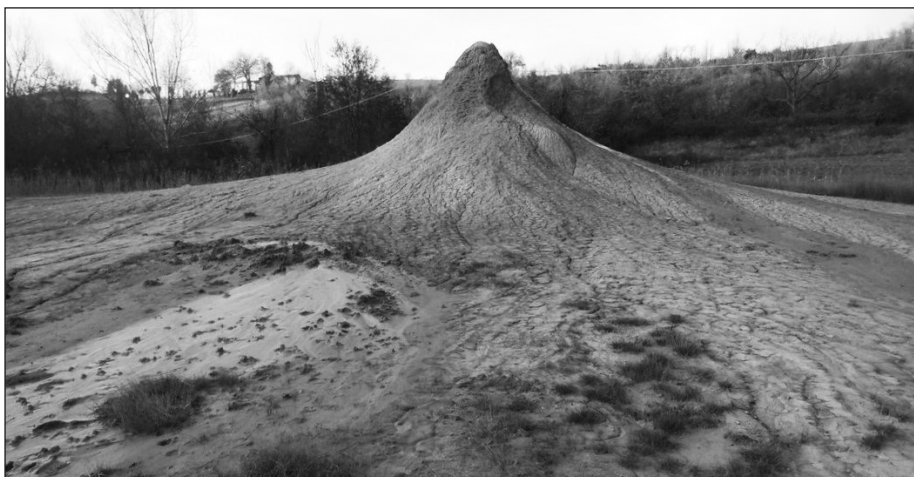
Fig. 8 – Salsa “B-Nando”, bellissimo esempio di cono singolo attivo (novembre 2016, foto D. Castaldini).