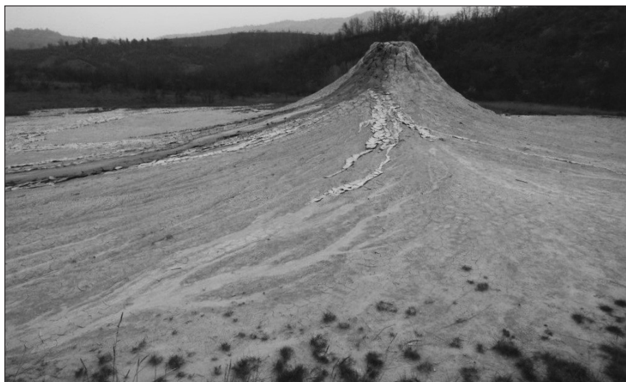
Fig. 10 – La Salsa “E-Egidio” situata al centro del campo delle salse (novembre 2016).