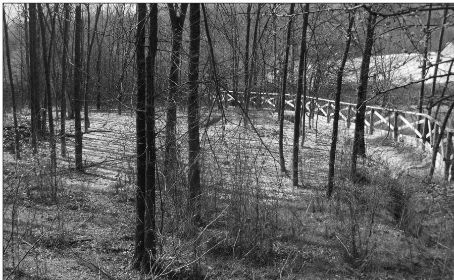
Fig. 5 – Le Salse “C-Garfagnine” nel boschetto a SO di Ca’ Rossa nel giugno 2016.