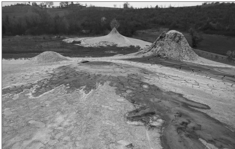
Fig. 9 – Sommità della Salsa “D-La Giunta”, costituita da un complesso di più punti lutivomi a cono e a polla. In secondo piano la “Salsa B-Nando” (marzo 2017).