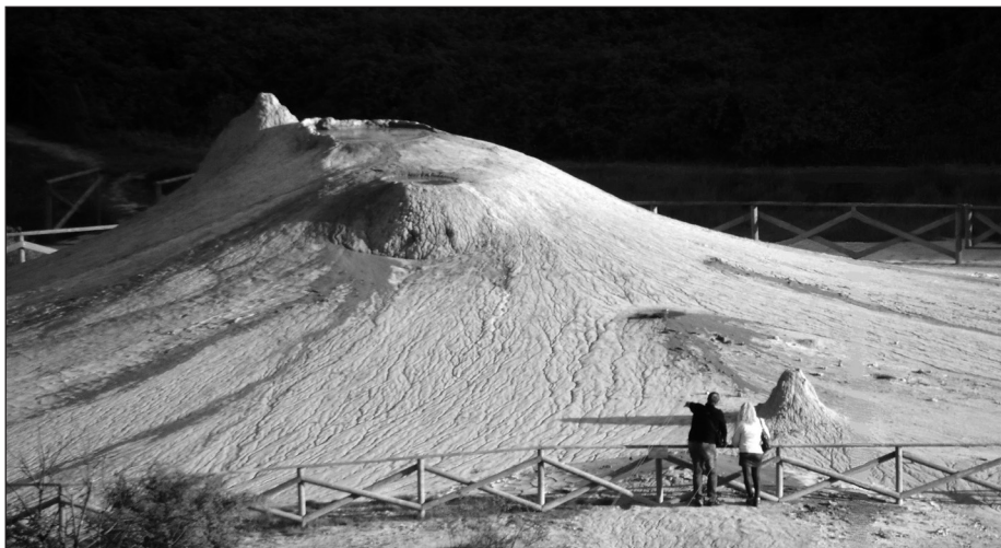
Fig. 11 – La Salsa “G-Fernando”: l’apparato lutivomo più vecchio e più grande di tutto il campo delle salse costituito da un complesso di più punti di emissione a cono e a polla (maggio 2016).