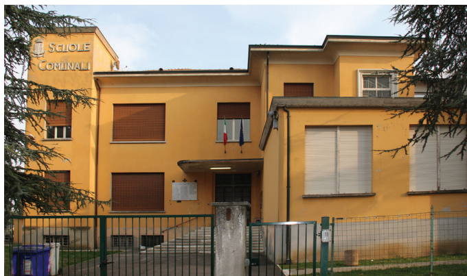
Fig. 3. Scuola elementare di Cadè (vista fronte)