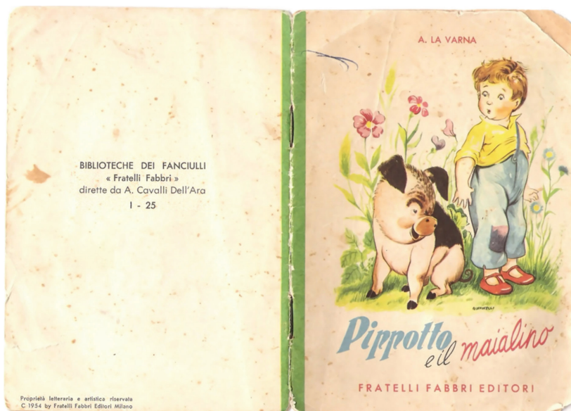
Figg. 6 e 7. Particolari del libretto 24