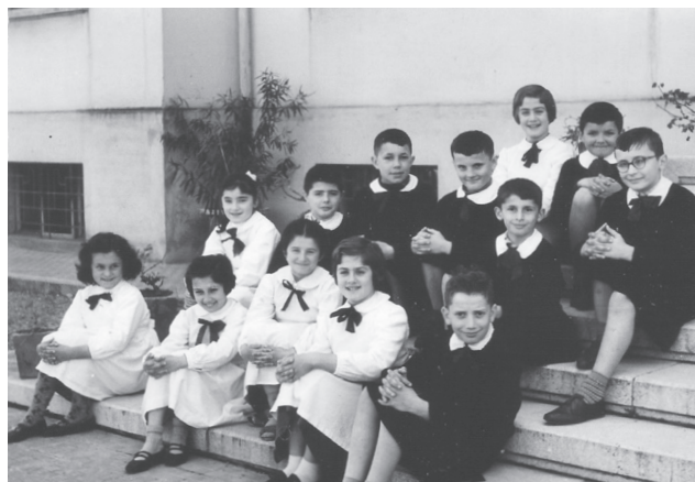
Fig. 8. Gli alunni della Classe IV - anno 1959

La fig. 8 ritrae un gruppo classe in posa per la consueta foto scolastica, gentilmente fornita da uno degli intervistati. Si tratta della classe IV dell'anno 1959. Si coglie naturalezza nella postura, sorriso sincero sui visi dei bambini e serenità che trapela dagli sguardi rivolti all'obiettivo, a conferma ed esempio di coesione e amicizia tra compagni, di cui diversi intervistati hanno parlato.