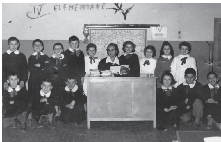
Fig. 9. Foto di classe con la maestra V.

La foto di classe di Fig. 9 mostra parte dell'arredo di una aula scolastica della scuola elementare di Villa Cadè, confermando i ricordi degli intervistati rispetto alla carta geografica posta alle spalle dell'insegnante e la lavagna girevole situata a fianco della cattedra.