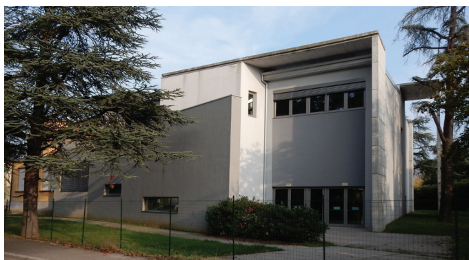
Fig. 4. Scuola elementare di Cadè - particolare dell'ala nuova 15

La scuola elementare di Cadè accoglie anche i bambini della vicina Villa Gaida, a conferma della costituzione, con la frazione vicina, oggi, di un unico agglomerato urbano. A Gaida, invece, è funzionante la scuola dell'infanzia, per la quale nel 2012 sono stati festeggiati i 100 anni dall'apertura.