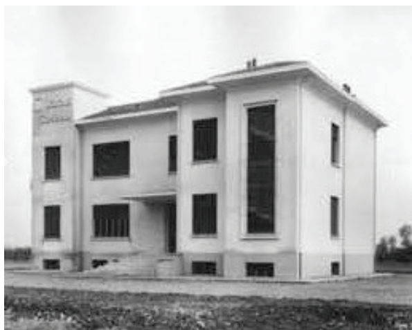
Fig. 2. Scuole elementari, Villa Cadè (RE), 1947-1948