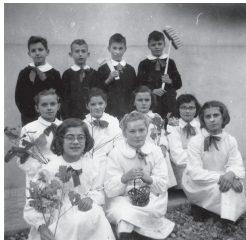
Fig. 5. Alunni in posa durante una recita con manufatti di loro produzione

Le testimonianze di questa ricerca evocano differenti microcosmi, per effetto dell'impostazione pedagogica, dei metodi didattici utilizzati, dell'approccio relazionale degli insegnanti, dell'assenza dei docenti titolari, della varietà caratteriale degli alunni.