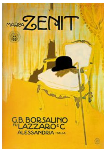
Fig. 3. Manifesto di Marcello Dudovich per Borsalino fu Lazzaro & C. (1911).

Per quanto riguarda la Borsalino fu Lazzaro, un passo decisivo in questa direzione si ha nel 1910 quando viene indetta una gara pubblica per pubblicizzare un nuovo prodotto, il cappello Zenit. Vince Marcello Dudovich 4 , un illustratore molto conosciuto nella prima parte del Novecento che propone un manifesto in cui il cappello è lasciato sulla sedia (cfr. fig. 3).