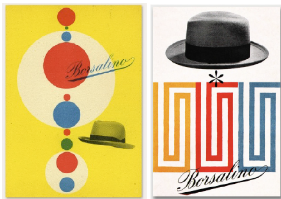
Figg. 10 e 11. Manifesti di Max Huber per Borsalino (1948-49).

e alla creatività comunicativa è stata favorita inizialmente da questa divisione dell'azienda e dalla sfida tra le due Borsalino, ma è poi continuata successivamente per molti anni dopo la riunificazione. Pensiamo per esempio alle campagne di fine anni Quaranta in cui Max Huber esprime il suo innovativo stile grafico oppure alla famosissima immagine in stile divisionista di Armando Testa del 1954.