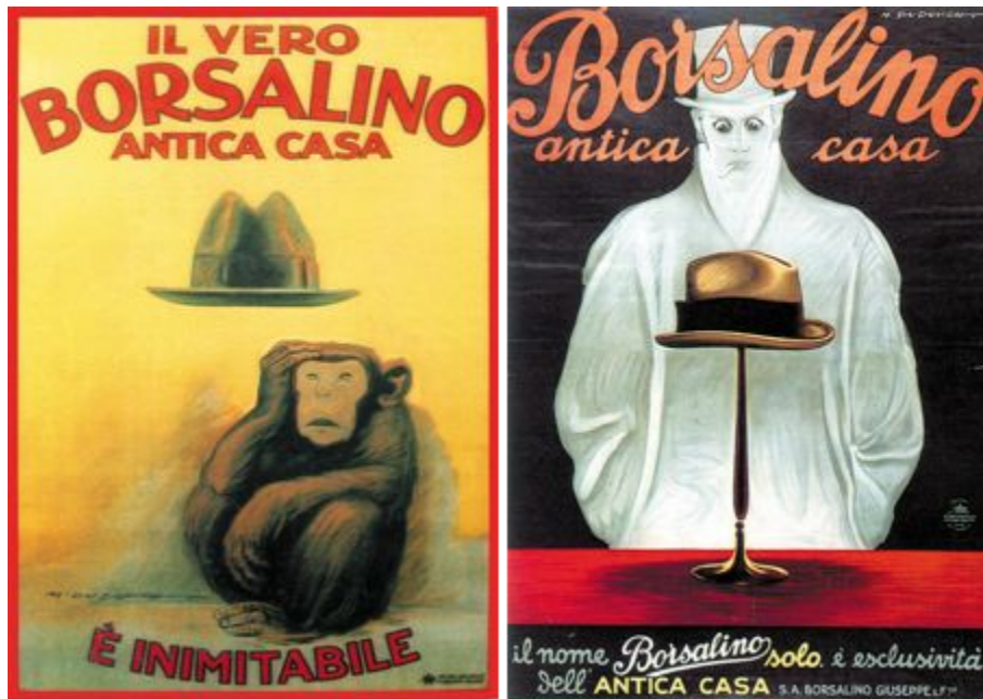
Figg. 4 e 5. Manifesti di Marcello Dudovich per Borsalino Antica Casa (1921 e 1924/28).

La Borsalino Antica Casa cerca da una parte di impedire alla rivale l'uso del nome dell'azienda, ormai sinonimo di cappello nel mondo; dall'altra però non può che accettare la sfida comunicativa e ingaggia gli stessi illustratori, primo tra tutti Dudovich. Durante gli anni Venti e Trenta, quest'ultimo firma diversi manifesti di entrambe le Borsalino, portando in primo piano il suo talento e, molti sostengono, anche una buona dose di opportunismo (cfr. figg. 4 e 5, 6 e 7).