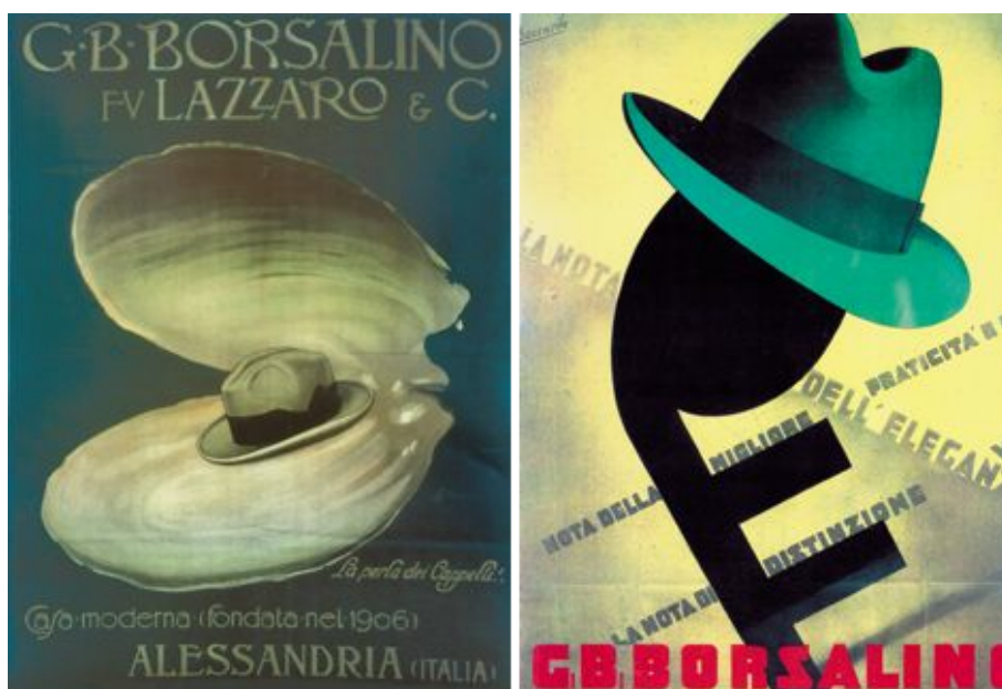
Figg. 8 e 9. Manifesto di Giuseppe Minonzio (1920) e Gino Boccasile (1933) per Borsalino fu Lazzaro & C.

I manifesti che presentiamo (figg. 8 e 9) sono due esempi della ricerca di nuove forme e contenuti da associare al prodotto pubblicizzato. Il cappello è sempre in primo piano e, giocando con la conchiglia o con una nota musicale, viene metaforicamente associato alla preziosità oppure all'eleganza del portamento.