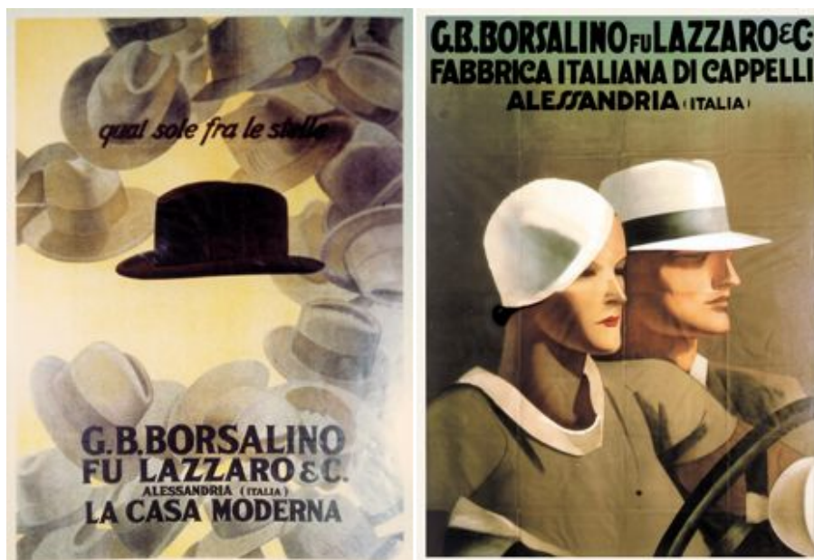
Figg. 6 e 7. Manifesti di Marcello Dudovich per Borsalino fu Lazzaro & C. (1930)

Se confrontiamo i manifesti che Dudovich ha ideato per le due Borsalino (cfr. figg. 4-5 e 6-7) non emergono particolari differenze dal punto di vista di cura formale e ideazione. Si potrebbe ritenere che la più innovativa dal punto di vista della storia della pubblicità sia la n° 6, dove spicca un cappello nero in mezzo a una corona di altri cappelli di color beige. Lo slogan: “quel sole fra le stelle” evidenzia il ruolo preminente del cappello Borsalino, che emerge nella sua lucentezza tra gli altri cappelli così come, per similitudine, il sole tra le stelle. Come nel manifesto del 1911 (cfr. fig. 3), il prodotto è in primo piano, così come nei manifesti della Borsalino Antica Casa (cfr. figg. 4 e 5), dove però non si rinuncia alla presenza di qualche altro soggetto secondario, come la scimmietta e il fantasma.