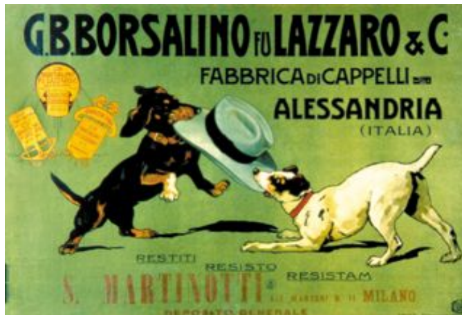
Fig. 1. Manifesto di Cesare Simonetti per Borsalino fu Lazzaro & C. (1906)

È interessante confrontare tale manifesto con una versione di qualche anno dopo, dove si è lavorato a creare una maggiore chiarezza di lettura (cfr. fig. 2). Rimangono identici immagine, nome dell'azienda in particolare evidenza e il messaggio, ma cambia il colore dello sfondo per creare maggiore contrasto e scompaiono gran parte delle altre scritte a vantaggio di una maggior nitidezza d'insieme.