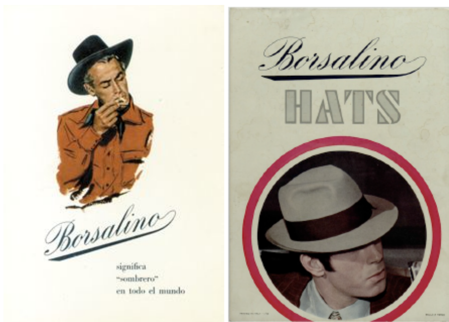
Figg. 13 e 14. Due annunci-stampa Borsalino degli anni Cinquanta e Sessanta.

Un capitolo a parte della comunicazione della Borsalino riguarda lo stretto collegamento con l'industria cinematografica hollywoodiana che, a partire dagli anni Venti, costruisce un indubbio canale di pubblicizzazione del prodotto e della marca. Nel nuovo star system non c'è nessun gangster senza il suo cappello e molti di loro, come Lucky Luciano, Al Capone o John Dillinger indossano un Borsalino. Così come poliziotti ed investigatori privati, che non possono fare a meno del loro fedora, il cappello a tesa larga, la cui ombra crea personaggi misteriosi. Diffusosi rapidamente in tutti i generi cinematografici, il cappello Borsalino è a lungo presente nell'immaginario collettivo, è il cappello per antonomasia, possiamo riferirci ad esso senza che l'azienda abbia la necessità di intraprendere nessuno sforzo per incentivare altra creatività.