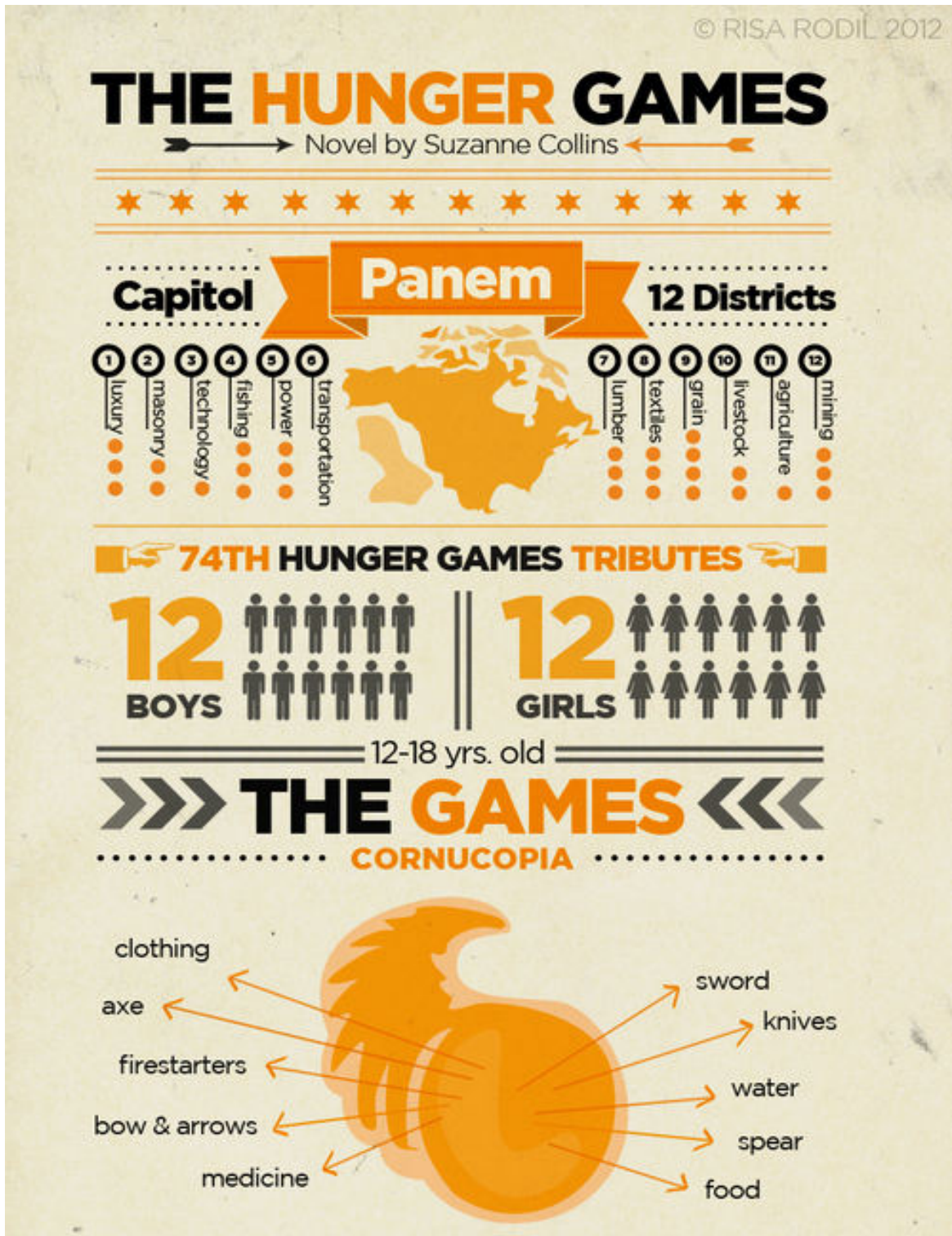
Figura 1: Topica di "Hunger Games".