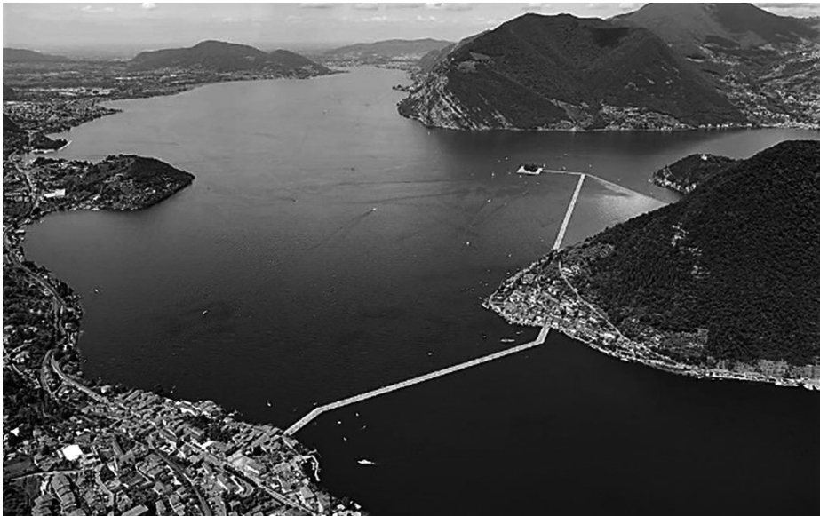
Fig. 1 – The Floating Piers

Introduzione. – Il Sebino è stato lo scenario in cui ha preso forma l'opera The Floating Piers dell'artista internazionale Christo (Fig. 1), sulla base di un progetto ideato con la moglie Jeanne-Claude, scomparsa nel 2009. L'evento si è svolto dal 18 giugno al 3 luglio 2016 e ha previsto l'installazione di due pontili galleggianti, ricoperti di tessuto giallo dalia, che hanno collegato il paese di Sulzano, sulla sponda bresciana del lago, con Monte Isola e poi con l'isola di San Paolo (1) , per una lunghezza complessiva di 4,5 km. L'opera, sviluppata a pelo d'acqua, aveva l'obiettivo di far «camminare sull'acqua» i visitatori, oltre che di gettare uno sguardo nuovo sul territorio lacustre.