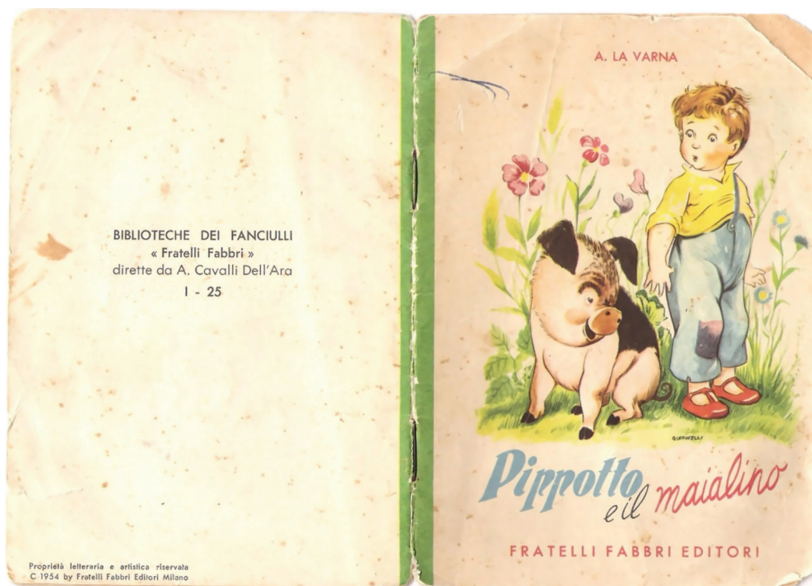
Figg. 6 e 7. Particolari del libretto 24