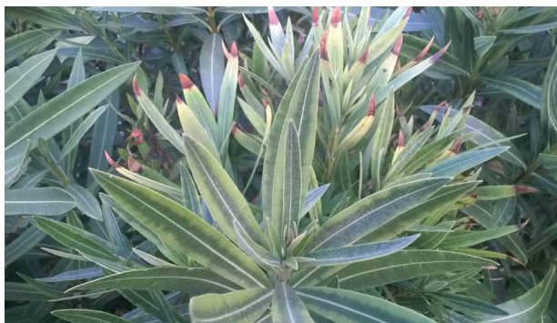
Tab. 1 – Elenco delle 33 specie vegetali che, oltre all’olivo, possono essere infettate da Xylella fastidiosa subsp. pauca , l’agente del Complesso del Disseccamento Rapido dell’Olivo (CoDiRO).

La vigente normativa europea sull’inquadramento fitosanitario degli organismi dannosi al-