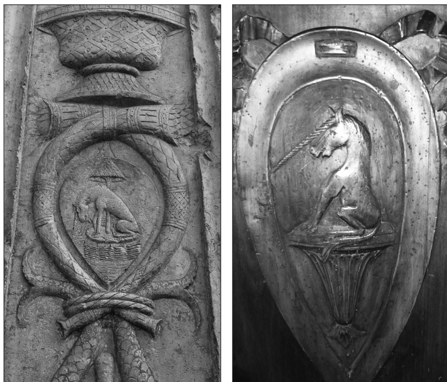
Fig. 2 – A) a sinistra: liocorno posto sul lato sinistro del portale d'ingresso di Palazzo Schifanoia, Ferrara; B) a destra: liocorno scolpito sul piedistallo ligneo che sorregge la statua di Borso d'Este a Palazzo Schifanoia, Ferrara.

Utilizzato nella simbologia araldica lo troviamo come cimiero sullo stemma dei Farnese di Parma, accompagnato da un leone nello stemma reale del Regno Unito, in coppia nello stemma reale di Scozia.