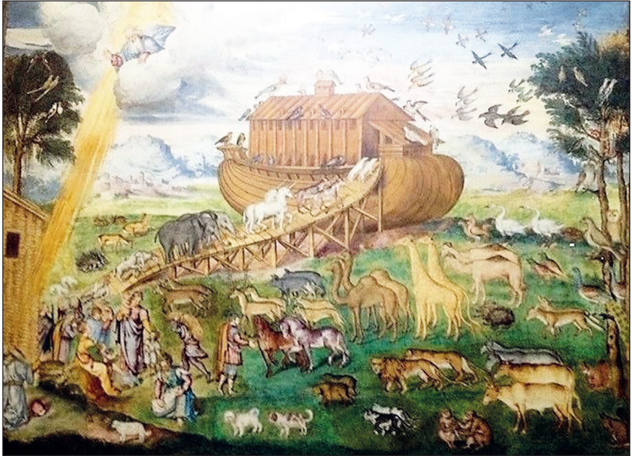
Fig. 1 – Una coppia di liocorni entra nell'arca di Noè, chiesa di San Maurizio al Monastero Maggiore, Milano.

Nel pavimento a mosaico (1163-1165) del Duomo di Otranto, in una delle sedici ruote che caratterizzano il presbiterio, è raffigurato un unicorno come simbolo di Cristo (Gianfreda, 2008). Il riferimento a questo animale nel Testo Sacro ha origine da una traduzione della Bibbia in lingua greca, detta dei Settanta, del termine ebraico re'em come unicorno. Traduzioni successive dall'ebraico al latino hanno invece identificato l'animale come rinoceronte o come bufalo ma delle tre bestie è l'unicorno a cui viene attribuita valenza simbolica (Ciccarese, 2007).