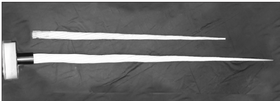
Fig. 4 – I due denti di narvalo conservati presso il Museo di Zoologia e Anatomia comparata dell'Università di Modena e Reggio Emilia.

Dei due denti a tutt'oggi conservati nel Museo di Zoologia non è possibile stabilire quale sia quello appartenuto alla collezione ducale. Anche il secondo dente potrebbe essere stato donato dal duca dopo averlo acquisito per eredità o dono; più difficile sia stato acquistato dato che ve n'era già uno e non vi era più il fascino dell'unicorno e la credenza nelle sue virtù terapeutiche. Anche una nobile famiglia modenese potrebbe essere all'origine del dono.