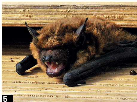
Serotino comune ( Eptesicus serotinus ) (foto 4) e in bat box (foto 5)