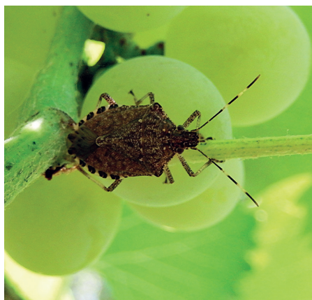
Foto 1 Adulto di H. halys su vite.

La cimice asiatica si sta diffondendo rapidamente in Italia causando danni consistenti alle colture. I pipistrelli possono rivelarsi efficienti predatori di questo insetto alieno, in grado anche di individuarne precocemente la presenza sul territorio (chirosorveglianza)