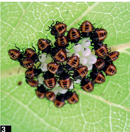
Foto 3 Ovatore e neanidi al primo stadio di H. halys .