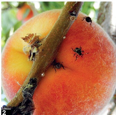
Foto 2 Neanidi di H. halys su pesco

La gestione di questa cimice aliena è intrinsecamente difficile, anche perché non vi sono prodotti specifici disponibili sul mercato che dimostrino piena efficacia. Negli Stati Uniti l'uso massiccio di insetticidi ad ampio spettro per cercare di contrastarla, oltre a non essere risolutivo, ha provocato gravi alterazioni