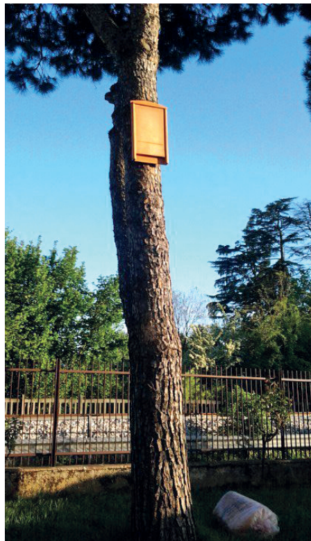
Foto 6 Bat box.

Dipartimento di scienze della vita Centro interdipartimentale Biogest-Siteia Università di Modena e Reggio Emilia